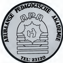
A.P.A. (S.M.O.A.): Hoe lang nog?

Zoals reeds is opgemerkt, werd het onderwijs in het begin van deze eeuw praktisch geheel verzorgd door de missie. Toen de koloniale overheid in 1920, onder druk van Nederland, verplicht werd het onderwijs te financieren, had het bijzonder onderwijs al zo'n overheersende plaats ingenomen, dat er